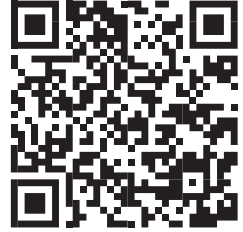
Ürün Video (Youtube)