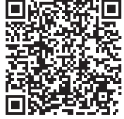
Ürün Video (Youtube)