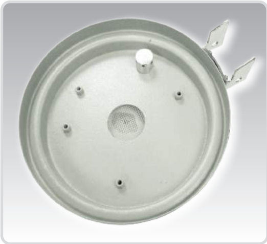
Filtre Temizleme Özelliği

Kontrol sistemi ile emiş süresi, çalıştırma modu (normal veya filtre temizlemeli...) ayarlanabilir. Hammadde bitmesinde, vakum hattında kaçak olma durumlarında sesli alarm sistemi ikaz verir.